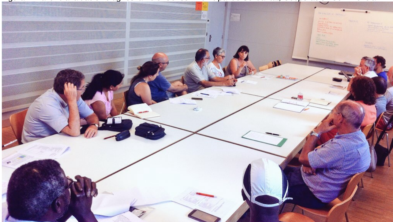
Figura 1: Taller d'avaluació i diagnosi amb el Consell Municipal de Solidaritat, Cooperació i Convivència

D'aquests documents, conjuntament amb impressions procedents de la resta d'actors -entitats, departaments municipals, universitat, etc.- recollides en el marc d'un procés participatiu dut a terme entre els mesos d'abril i octubre 2017, se'n van extreure algunes valoracions clau per a la continuïtat de l'esforç de solidaritat de la ciutat de cara al següent Pla Director de Cooperació. Aquestes valoracions es presenten a continuació en format d'avaluació del PDSiC 2013 – 2016.