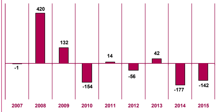
Variació de l'atur registrat al mes de novembre respecte del mes anterior. Mataró. 2007 - 2015

Per grups d'edat, l'atur registrat s'ha reduït en els tres grups. El més rellevant és el descens d'un -19,4% entre els menors de 25 anys, col·lectiu amb un total de 602 desocupats. Els que tenen entre 25 i 44 anys presenten un descens del -14,7% i acumulen 4.822 aturats. Finalment, la davallada més moderada s'ha produït en el grup dels que en tenen més de 44, amb un -5,7% i un total de 6.549 desocupats registrats.