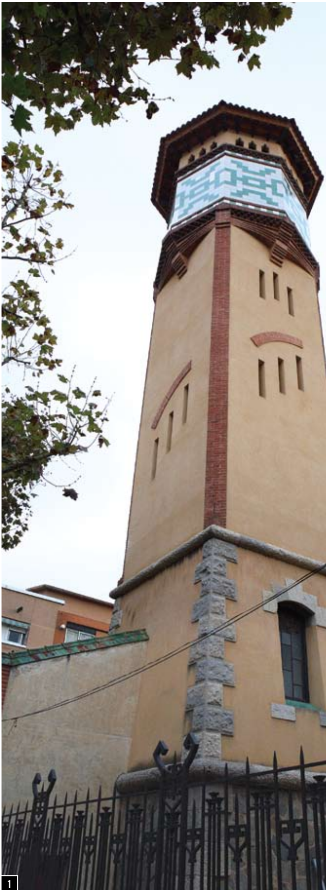
1. Vista de l'edifici central de l'Escorxador, futura seu de la Biblioteca Antoni Comas.