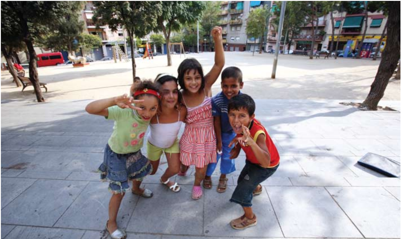
Els programes socials de la Llei de barris fomentaran la convivència i la integració social.

La Llei de barris contempla una sèrie de programes que tenen l'objectiu de fomentar la integració social i cultural i de millorar la convivència i la qualitat de vida del veïns.